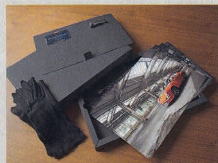
Hochwertige Aufnahmen als Endprodukt

■ Bildermeister veranstaltet 2017 an ausgewählten Locations im gesamten Bundesgebiet, aber auch in Österreich und der Schweiz Fotoshooting-Events, die für jeden Autobesitzer offen sind. Die Preise für ein Fotoshooting beginnen bei 199 Euro. Die Termine 2017: Frankfurt (20., 21., 22. April), Stuttgart (4., 5., 6. Mai), München (18., 19., 20. Mai), Hamburg (8., 9., 10. Juni), Köln (22., 23., 24. Juni), Berlin (13., 14., 15. Juli). Weitere Termine folgen. Glöckner und sein Team fotografieren auch private Sammlungen. Infos und Anmeldung unter www.bildermeister.com