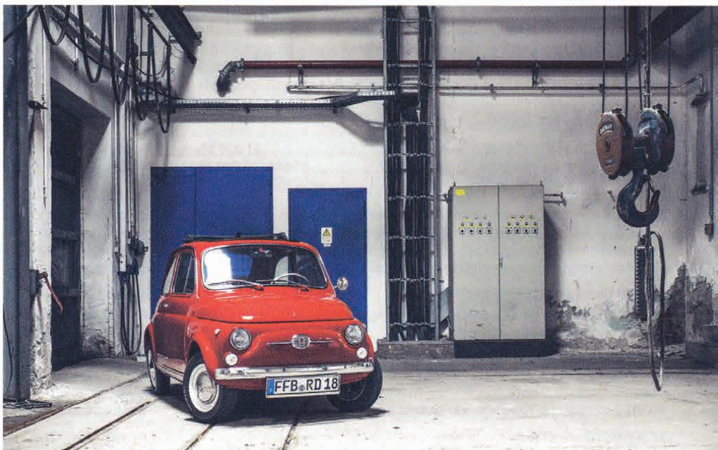
Sieht aus wie gerade geparkt, doch bei diesen Aufnahmen ist nichts dem Zufall überlassen

Preislich beginnen die Fotoshootings bei 199 Euro. „Dafür erhält der Kunde bereits eine Total- sowie eine Detailansicht seines Klassikers, eine Fotobox, zwei Hochglanzabzüge (20 × 30 cm) und einen USB-